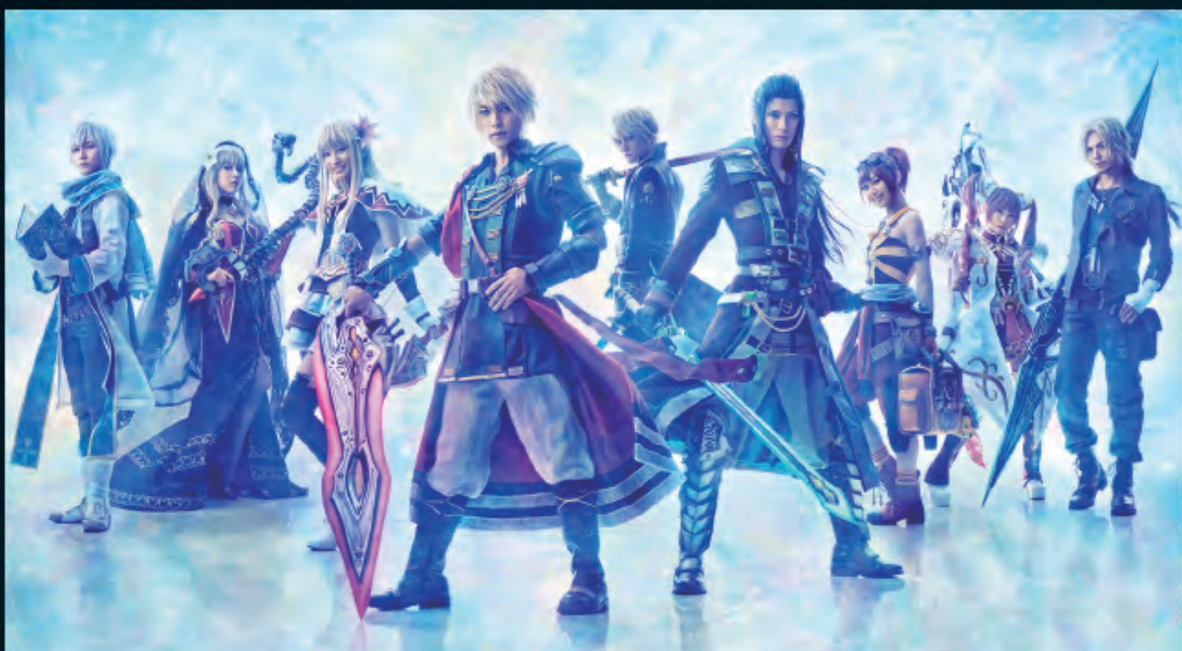
▲ 「FINAL FANTASY BRAVE EXVIUS」THE MUSICALの衣裳展示